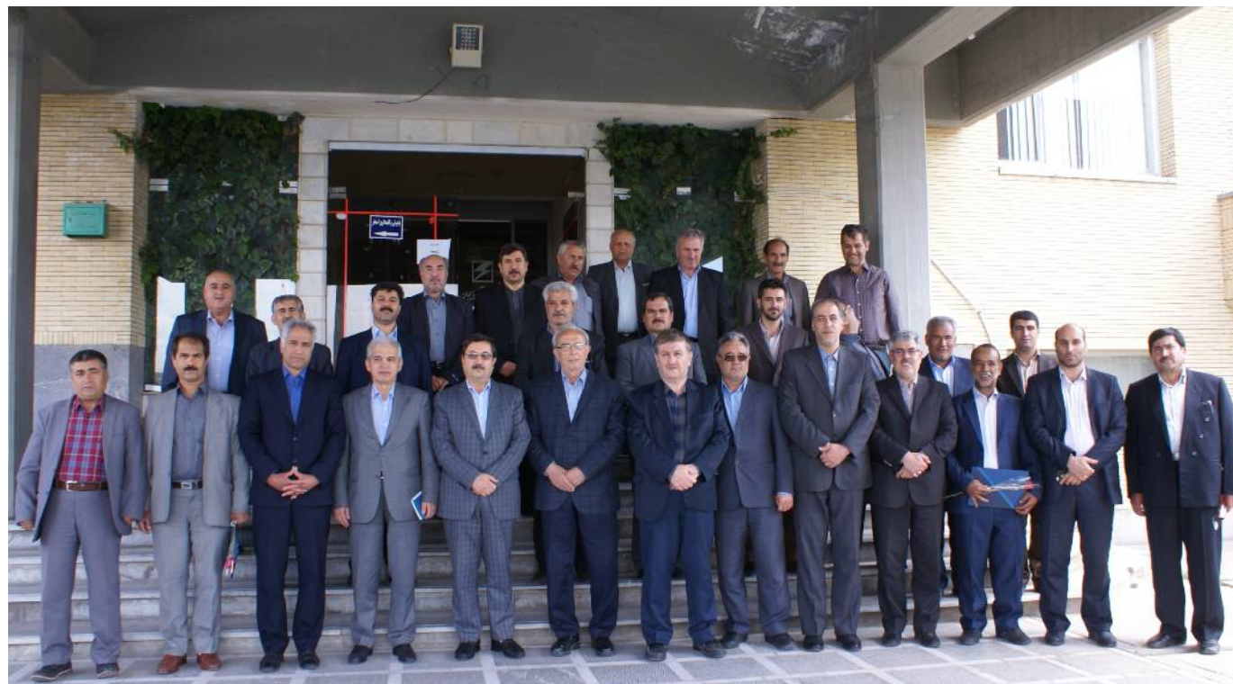
مجلس از آزادگان و حائزان