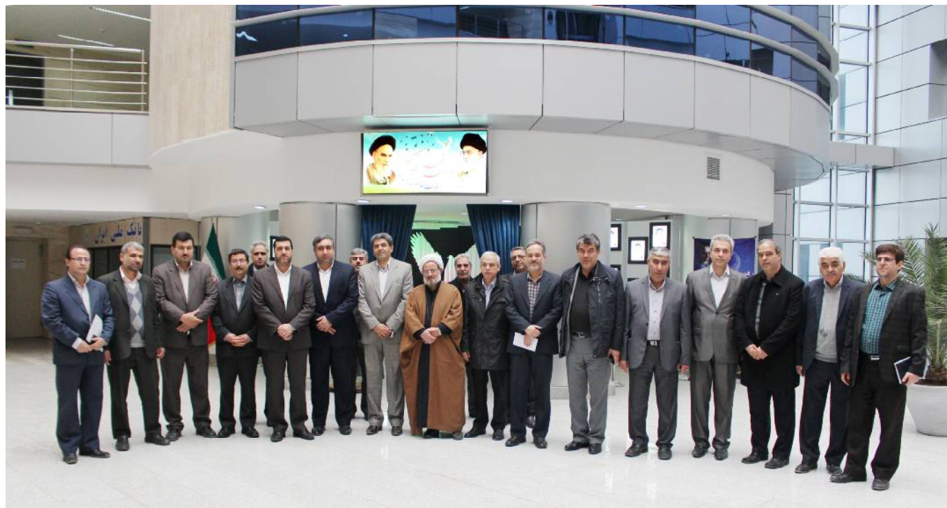
حضور مدیر عامل شرکت توانیر همراه مقامات استانی و مدیران عامل صنعت برق آذربایجان